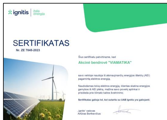
2 pav. Žaliosios energijos sertifikatas