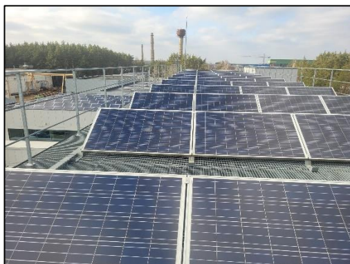
1 pav. Bendrovės saulės elektrinė

Įgyvendinant energijos taupymo tikslus, buvo nuspręsta pirkti elektros energiją, pagamintą iš atsinaujinančiųjų išteklių. 2023 m. pabaigoje buvo pasirašyta sutartis su „Ignitis“ dėl žaliosios elektros energijos pirkimo. Visa Bendrovės naudojama energija (100 proc.) bus gaunama iš atsinaujinančiųjų išteklių. Gautas Žaliosios energijos sertifikatas Nr. ZE7845–2023.