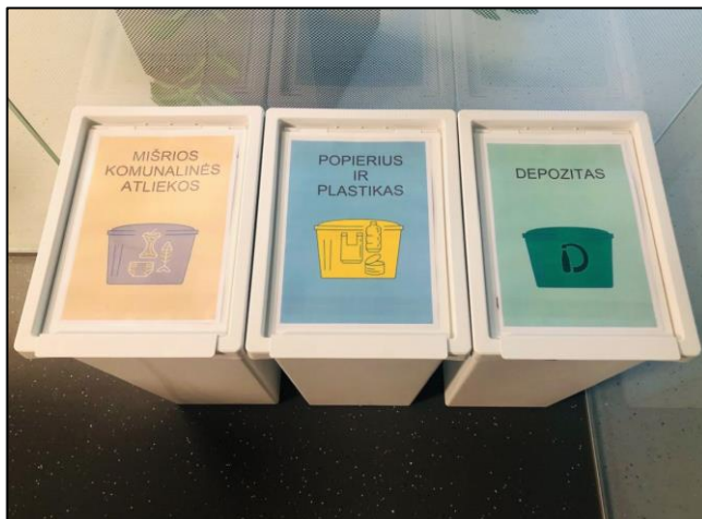
4 pav. Bendrovėje įgyvendinta VASA iniciatyva „Nulis šiukšlių po stalu“

Didžiausią dėmesį Bendrovė skiria tinkamam pavojingų bei statybinių–laboratorinių atliekų sutvarkymui. Ši praktika apima atliekų susidarymo minimizavimą bei tinkamą atliekų sutvarkymą, atitinkantį nacionalinius teisės aktus.