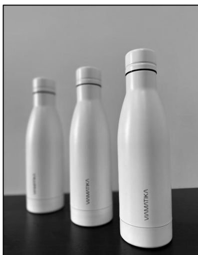
5 pav. „VIAMATIKA“ gertuvė

Bendrovės biure atsisakyta 95 proc. geriamojo vandens plastikiniuose buteliuose. Darbuotojams nupirktos gertuvės – taip skatinamas geriamojo vandens iš čiaupo vartojimas.