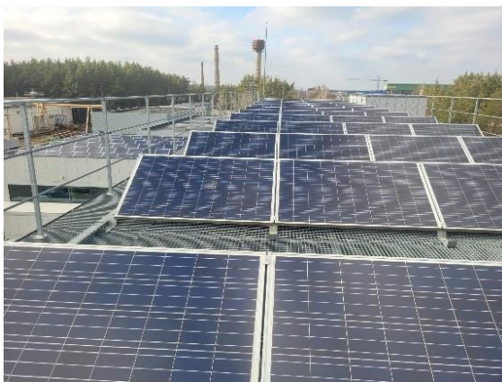
1 pav. Bendrovės saulės elektrinė