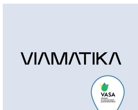
4 pav. AB „VIAMATIKA“ įgyvendinama VASA iniciatyva „Nulis šiukšlių po stalu“

Didinamas darbuotojų sąmoningumas apie atliekų kiekio mažinimo ir rūšiavimo naudą. 2023 m. Bendrovė prisijungė prie Vilniaus atliekų sistemos administracijos (VASA) iniciatyvos „0 šiukšlių po stalu“. Darbuotojai įprato naudotis patogiose vietose įrengtomis buitinių atliekų rūšiavimo dėžėmis.