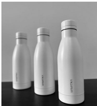
5 pav. „VIAMATIKA“ gertuvė

Bendrovėje vandens apskaita vykdoma pagal vandens skaitiklių rodmenis. Išleidžiamų buitinių nuotekų kiekis apskaičiuojamas pagal sunaudoto vandens kiekį. Nors Lietuvoje vandens išteklių netrūksta, Bendrovė yra suinteresuota jais naudotis atsakingai – tausoti resursus ir tuo pačiu mažinti išlaidas. Geriamasis vanduo, pagal sudarytą pirkimo sutartį, perkamas iš UAB „Vilniaus vandenys“, o nuotekos šalinamos į centralizuotą tinklą ir patenka į šios įmonės valymo įrenginius.