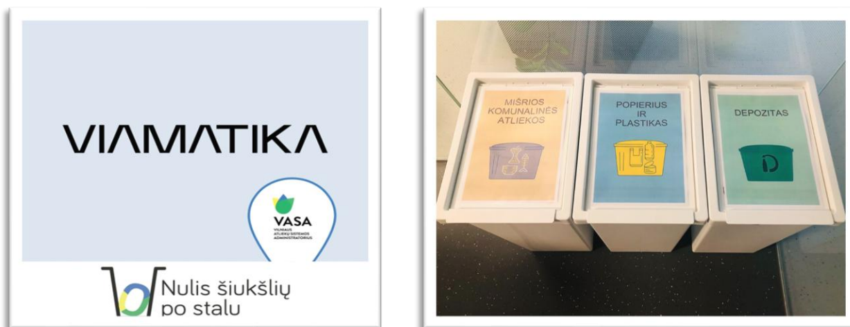
5 pav. AB „VIAMATIKA“ įgyvendinama VASA iniciatyva „Nulis šiukšlių po stalu“

Didžiausią dėmesį Bendrovė skiria tinkamam pavojingų bei statybinių ir laboratorinių atliekų tvarkymui. Ši praktika apima atliekų kiekio mažinimą bei tinkamą atliekų tvarkymą, atitinkantį nacionalinius teisės aktus. Bendrovė turi sudariusi sutartis su patikimais atliekų tvarkytojais.