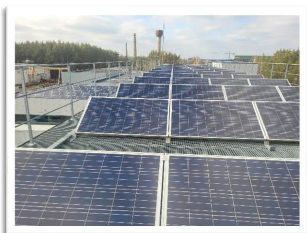
2 pav. AB „VIAMATIKA“ saulės elektrinė